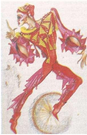
С. Горская. Эскизы цирковых костюмов.