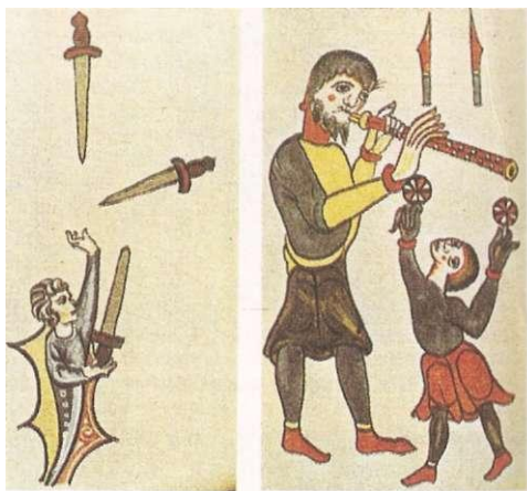
Жонглёры на средневековых миниатюрах.

Расцвет иск-ва Ж. бытовыми предметами связан с появлением на рубеже 19—20 вв. салонных