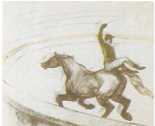
А. де Тулуз-Лотрек. «Жокей»

Первые Ж. появились на цирковой арене в 70-х гг. 19 в. Одни считают первым цирковым