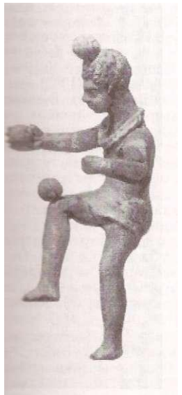
терракотовая фигурка жонглёра из Фив.