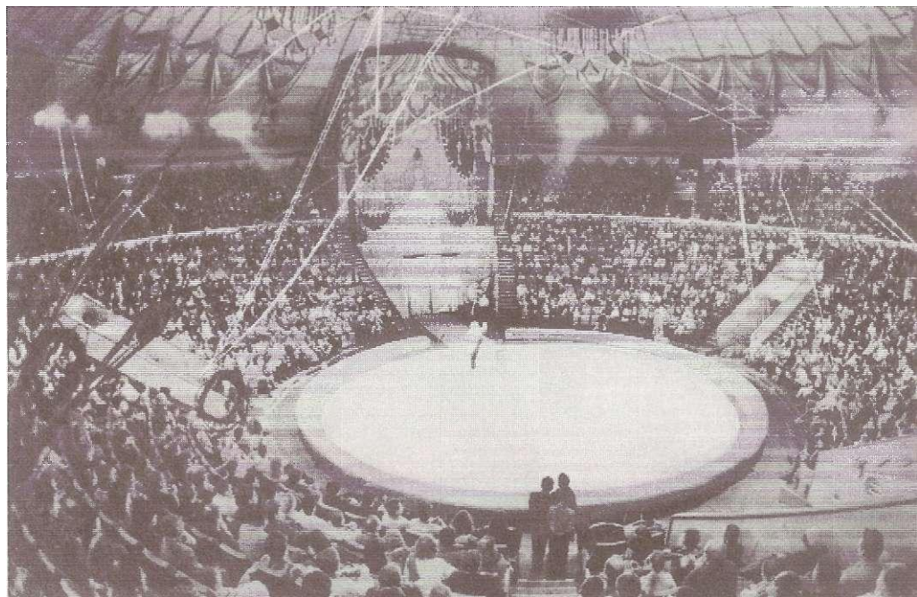
Зрительный зал Большого Московского цирка на пр. Вернадского.

Большой Московский цирк на проспекте Вернадского открылся 30.4.1971. Здание соответствует последним достижениям цирковой архитектуры и техники (коллектив архитекторов и инженеров: Я. Белопольский, Е. Вулых, С. Феоктистов, В. Хавин). Вместимость 3350 мест. Особое достоинство Большого Моск. цирка — его манежи. Мощный гидравлич. подъёмник в считанные минуты на глазах публики превращает арену то в ледяное