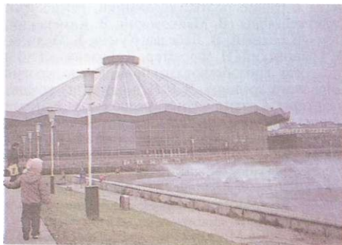
Большой Московский цирк на пр. Вернадского.