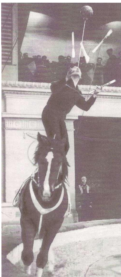
19 Цирковое искусство России