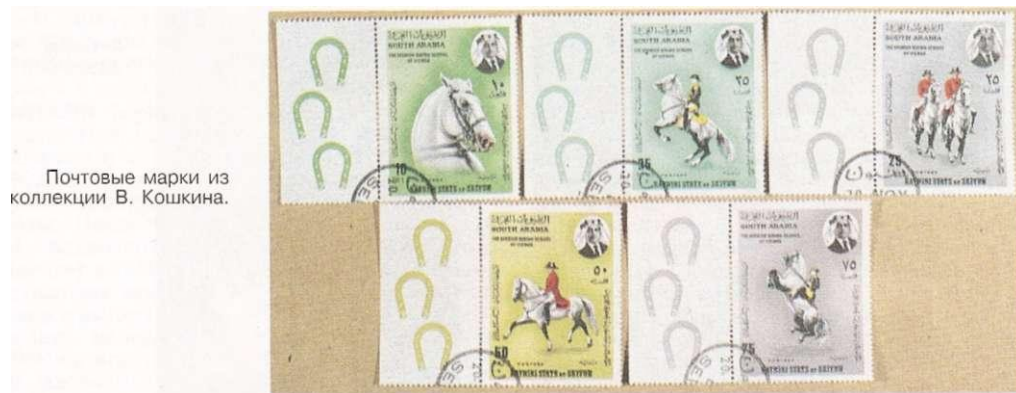
Почтовые марки из коллекции В. Кошкина.

Позже иск-во В. ш. совершенствовалось на многочисл. конных играх, каруселях, в конных балетах. Интерес к иск-ву верховой езды возрос в Зап. Европе в 18 в.: повсюду возникали кавалерийские школы — «конные академии», где обучались верховой езде под рук. берейторов .